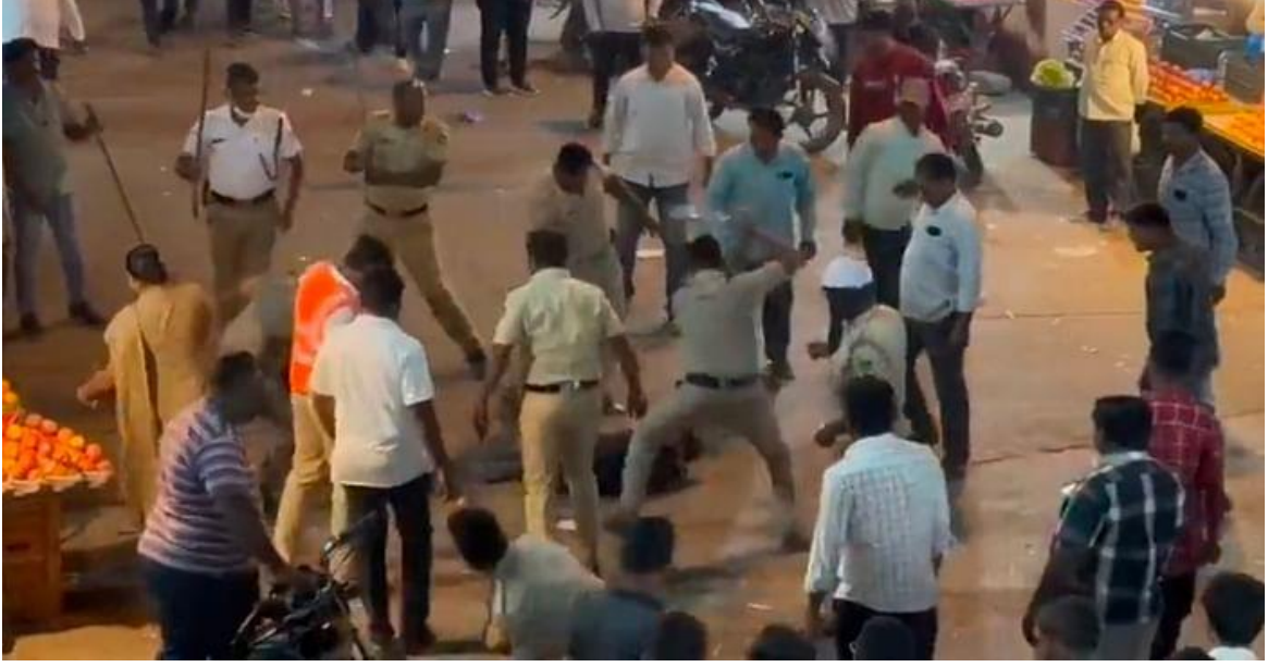
கத்தி வைத்திருந்த நபரை தாக்கும் போலீஸார்

Published:13 Feb 2023 6 PM Updated:13 Feb 2023 6 PM