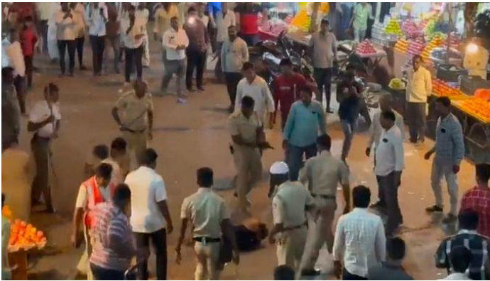
துப்பாக்கியால் சுட்ட எஸ்.ஐ