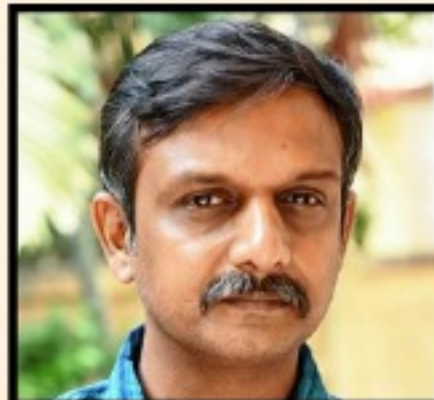
திருமுருகன் காந்தி மே 17 இயக்கம்